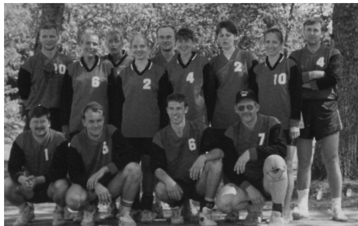
Valla suvemänguderaudvara on võrkpallurid.

Eks ideid ja mõtteid rahva sporti kaasamiseks on teisigi, sest Ülenurme valla kallim vara on inimeste tervis ja heaolu.