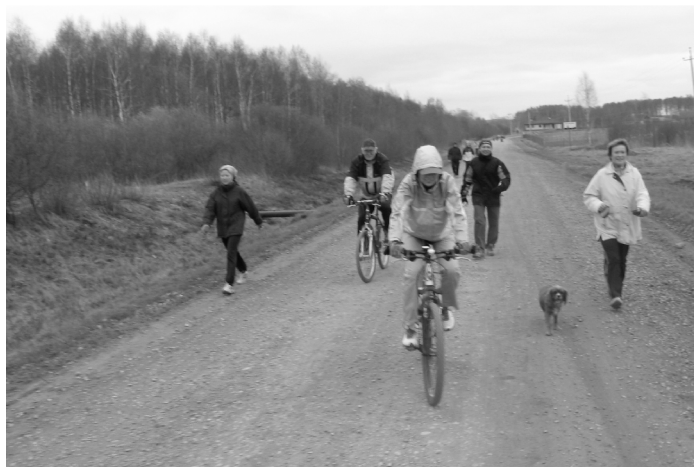
Jookse, jaluta või sõida rattaga - esimene Volbrimatk.