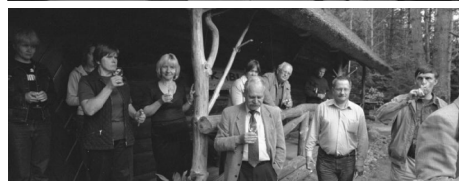
Põlva Maakonna Spordiliidu tähtpäeval osalejad meenutasid tehtut ja nautisid Käbliku turismitalu mõnusat õhkkonda.