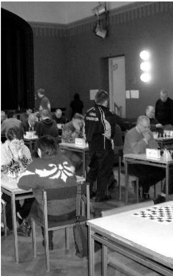
Pildimeenutusi valdade talimängudelt.