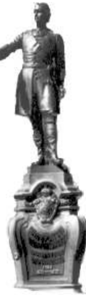
Peeter I monument

Oleme Eestimaal saavutanud mõndagi sporditöö ümberkorraldustega. Samas ei ole mingit põhjust suhtuda üleolevalt Karjala spordiorganisatsioonide