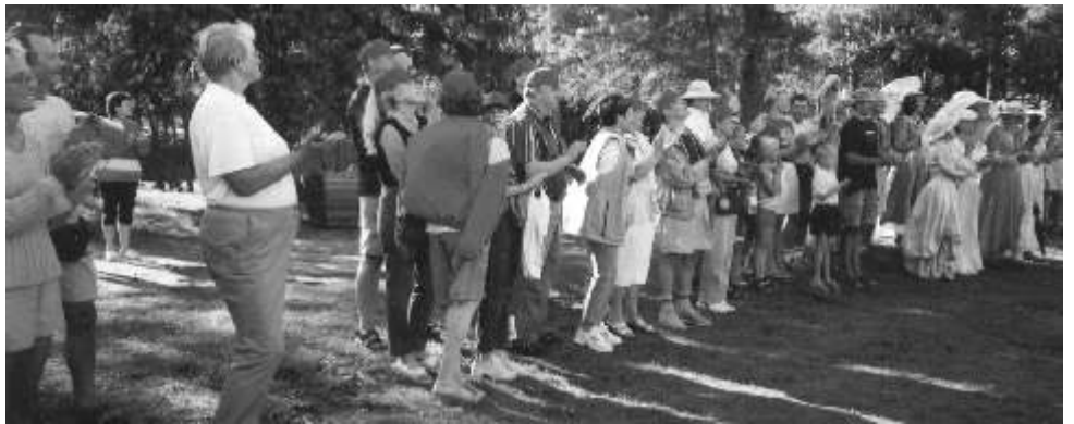
Hetk kokkutuleku avamiselt.