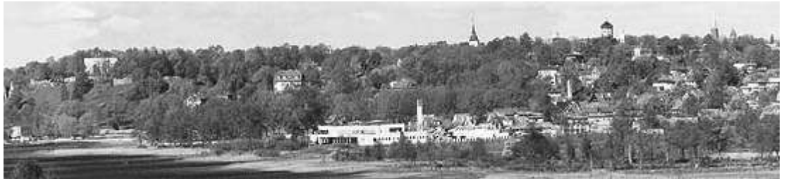
Eesti XI Maaspordimängude finaaloistlused toimuvad Viljandis.

Loodan, et võistkondade ja võistlejate ettevalmistamisel ning lähetamisel löövad aktiivselt kaasa meie maakondlikud spordiühendused, aga ka omavalitsuste spordiklubid ning arvukad maaspordi aktivistid.