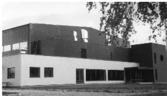
Tartu valla spordihooned Lähel on üks kahe kongressi vahel valminud spordirajatistest.

Läbi aegade on maasporti saanud rida traditsioonilisi ettevõtmisi. Rääkides aga uutest suundadest ja vormidest,