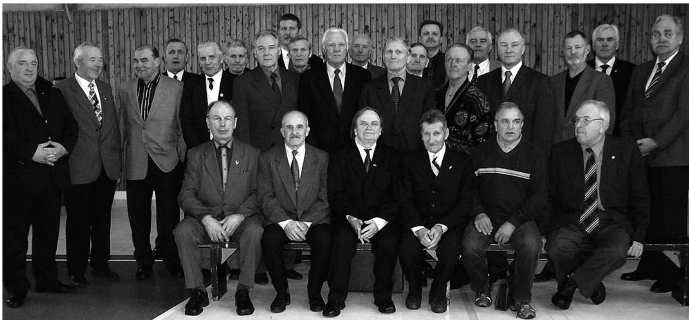
■ Ühispildil on Jõu maadlus- ja tõstesportveteranid, kelle hulgas oli nimekaimana olümpiavõitja ja maailmameister Jaan Talts, aga ka üleliidulised maanoorte meistrid ja Eesti meistrid.